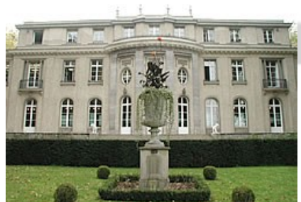
Haus der Wannseekonferenz