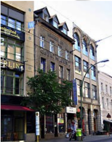
Anne Frank Zentrum

Dieses mal schwärmten die Teilnehmer in kleinen Gruppen aus, um Berliner Orte mit wichtiger Bedeutung aufzusuchen und am Abend von ihren eigenen Erfahrungen zu berichten.